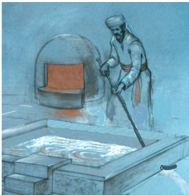
מקוה שכשרותו נשמרת על ידי דבר המקבל טומאה. המקוה ניקב, והאדם אוטם אותו בעזרת מקל, המקבל טומאה מדרבנן. לדעת רבנו שמשון, מכיוון שכשרות המקוה תלויה בסתימה זו - אסור לאטום אותו על ידי דבר המקבל טומאה.

כשהם מכונסים במקום אחד, ולא כשהם זוחלים (רמב"ם הל' מקוואות ט,ח). לדעת ר' יהודה במקרה זה ניתן לסמוך