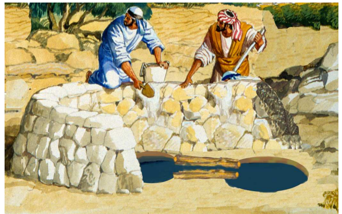
מקוה שנוצר על ידי דבר המקבל טומאה. העברת המים מבור אחד למשנהו באמצעות המקל נועדה להשלים את שיעור ארבעים סאה למקוה. לדעת הרא"ש, מכיוון שבמקרה זה יצירת המקוה תלויה בדבר המקבל טומאה - הרי הוא פסול, ואילו מקוה כשר שאירעה בו תקלה - ניתן לשמור את כשרותו גם על ידי דבר המקבל טומאה.

הרא"ש (שם) כותב שפירוש הר"ש אינו מחוור, משום שלא מסתבר שלדעת ר' יוסי דין 'הוייתן' נאמר גם במניעת הזחילה, ומכיוון שנעשה המקוה בכשרות – מותר לשומרו כך גם באמצעות דברים המקבלים טומאה, "ולא מקרי