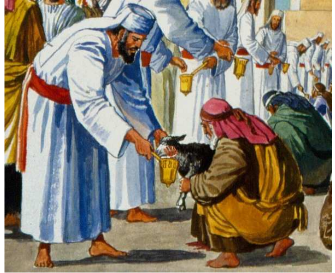
קבלת הדם לשיטת הרמב"ם: הכהן אווז את הקנה והוושט ומכניס את הווירידים לחלל הכלי, כדי שכל דם הפר יתקבל בכלי.

עוד נראה מלשונו "ומוציא... לתוך המזרק", ומדבריו בפיה"מ "ויבליטם" וכו', שהדברים כפשוטם, שיש להכניס את הווירידים לחלל המזרק ממש (אבן האזל שם הל' ט; אך עיין הר המוריה, שפירשו כרש"י). אם כן, לדעתו 'אוויר הכלי' הוא החלל שבתוך דפנותיו, ולא האוויר שמעל הכלי (וראה במערכה הבאה).