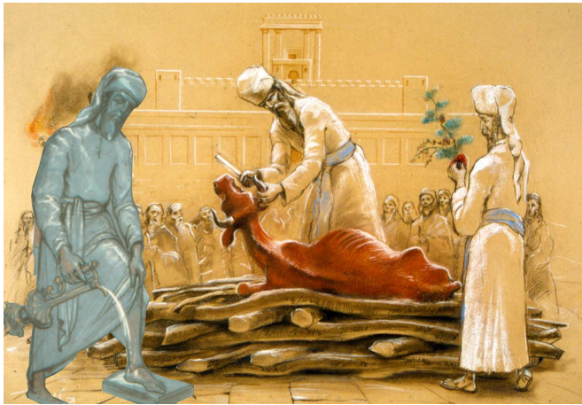
כהן מקדש ידיו ורגליו לעשיית פרה אדומה. נחלקו אמוראים האם קידוש זה צריך להעשות דווקא במקדש, או גם במקום עשיית הפרה, כמתואר בציור. להלכה הקידוש מחוץ למקדש כשר בדיעבד.

טומאה, כדי להמנע מכל חשש טומאה! (תוס' יו"ט בפרה ד,א). יש אומרים, שהגמ' כאן אומרת את עיקר הדין מדאורייתא (משנה אחרונה' שם; חסדי דוד לתוספתא פרה ד,ד, ועוד). ויש מהראשונים שצמצמו את החובה להשתמש בכלים שאינם מקבלים טומאה לשבוע של ההכנות לפרה אדומה והשהייה בלשכת בית האבן בלבד, ולא למעשה שריפת הפרה (תוס' ישנים יומא שם ד"ה שכל מעשיה; להרחבה בעניין זה ראה 'שערי היכל' למסכת יומא, מערכה ד), ולשיטתם הקושיה מיושבת. יתכן לתרץ אחרת, שהמקידה של חרס היא כלי שבור שאינו מקבל טומאה כלל 4 .