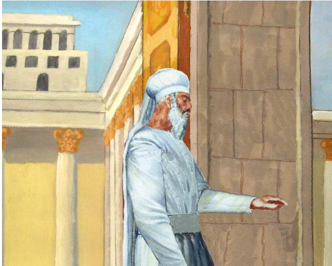
כהן מוציא את ידיו מהעזרה. בברייתא נאמר שהוצאת הידים אינה מחייבת לקדש אותם מחדש, מפני שהיא יציאה חלקית ואין בה היסח הדעת. יש להעיר, שחלל השער עצמו נחשב בדרך כלל כעזרה, פרט לשער ניקנור, שחללו לא התקדש (פסחים פה,ב).

להבנת יסוד הפסול יש השלכה על הלכותיו, כגון, במקרה שברור לכהן שלא הסיח דעתו בשעת היציאה. דעת כמה אחרונים, שבמקרה זה אין ספק שאינו צריך לשוב ולקדש (ש"ת ושב הכהן סי' ב; מראה הפנים יומא פ"ב ה"א), ונראה שלשיטת רש"י אין מקום לדבריהם. ויש החולקים על כך וסוברים, שגם לדעת תוס' פסלו חכמים את כל היוצא והחשיבוהו כהיסח הדעת (ר"י קורקוס הל' ביאת המקדש ה"ד; קרן אורה; גרי"ז, וכשיטתו הנ"ל בהסברת תוס'; ובליקוטי הלכות הסתפק בדבר). 3