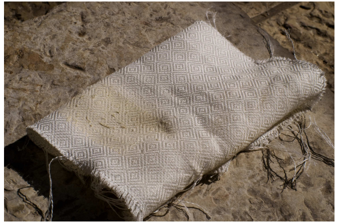
בגד שחוק. בד זה נשחק ולכתחילה אינו ראוי לשמש בקודש, מפני שאינו נחשב "לכבוד ולתפארת" (רמב"ם).

המושג "חדשים" אינו מוגדר כל צרכו, אבל מצאנו בראשונים הגדרה שעל פיה גם בגד משומש דינו כחדש, ובלבד שעודנו שער ואינו משופשף (מפרשי הספרא). בשחיקה מרובה מאד, נראה שלדעת הרמב"ם והמאירי הרי זה פסול לגמרי, וזהו "מטושטש".