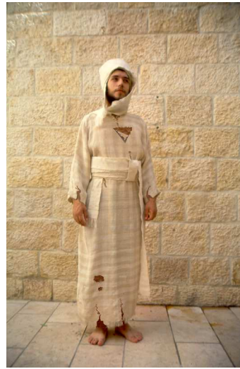
"בגדי מקורעים". כאשר בגד הכהונה בלוי ובו קרעים מרובים, והקרע אף מחסיר חלק מן הבגד - עבודתו של הכהן פסולה. יש אומרים שהוא אף חייב מיתה בידי שמים, כדון "מחוסר בגדים".

באשר לאפשרות לתפור את הבגד ולתקן את הקרע, ראה 'שערי היכל' למסכת יומא, מערכה כפג.