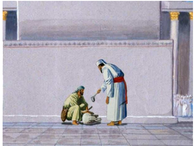
שחיטה ליד המזבח. לדעת רש"י ותוספות אין חובת הולכה, והשוחרט ליד המזבח יכול לזרוק את הדם משם. הרמב"ם, לפי הבנת רוב האחרונים, סובר שגם במקרה זה חובה להוליך את הדם ברגל.

לעומת זאת הרמב"ם (הל' פסולי המוקדשין א, כג) פוסק: "והולכה שלא ברגל אינה הולכה, לפיכך כהן שקבל את הדם ועמד במקומו וזרקו למזבח – נפסל הזבח". לדעתו חובה לעשות הולכה כלשהי ברגל, אפילו כששוחרט בצד המזבח (משנה למלך; חק נתן טו, א; חסדי דוד זבחים א, ה: "ואפילו שחט על גבי המזבח – בעינין קצת הולכה ברגל" 2 ). כדבריו מבואר בספרא (צו פרשתא ח, ה): "רבי מאיר אומר: מחשבה פוסלת בהילוך, שאי אפשר לעבודה בלא הילוך" 3 . בקרן אורה (טו, א) פירש על פי שיטתו את הגמ' "תאמר בהולכה" וכו', שזוהי הוזה-אמינא שנאמרה טרם הבאת הדרשה על הולכה מ"והקריבו" (עיין בסוגיה שם), ודרשה זו מלמדת שההולכה חובה. תירוץ אחר בעזרת כהנים (על הספרא שם), ש"אפשר לבטלה" היינו לבטל את מקצתה. אולם בזבח תודה (ד"ה אתמר) סובר שאף הרמב"ם חייב ללכת ברגל רק במקרה מסוים, כששחט רחוק מהמזבח ואין דרך לזרוק משם, ולכן חובה לקרב את הדם למזבח בהולכה ברגל" 4 .