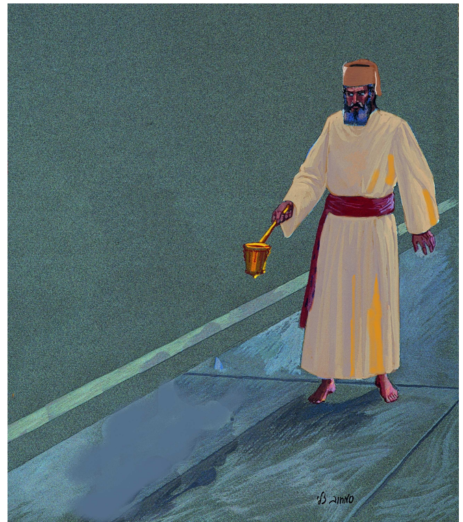
הולכה בבגדי חול. מסקנת הגמרא שהולכה היא עבודה לכל דבר, וטעונה בגדי כהונה, ולפיכך המוליך בבגדי חול – הולכתו פסולה.

הסוגיה מבררת את מעמדה של ההולכה: האם חובה לעשותה, והאם דינה כשאר העבודות לעניין זה שהחושב בשעת עשייתה מחשבה פסולה (מחשבת שלא לשמה, או פיגול) פסל את הקרבן.