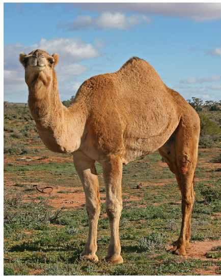
הגמל מכה ברגליו גמלים שסביבותיו. מדוע?

[במקום אחר הארכתני שלכן ה"גמל" הוא כנגד "ישמעאל", כי גם ישמעאל יש לו לפעמים פנימיות טובה (ערכים של צניעות, משפחתיות, הכנסת אורחים, אמונה ביחוד ה', נכבדות, וכו') אבל חיצוניות רעה, הוא מוכן לשחוט ולרצוח את קרובי משפחתו באכזריות מטורפת בשביל להשליט את ה"טוב" הפנימי שלו. לעומת זאת עשיו הוא כנגד ה"חזיר", בחיצוניותו הוא טוב ונעים (מפריס פרסה) אבל בפנימיותו הוא רע (אינו מעלה גרה). עשיו מתנהג בעדינות ובאנושיות, אבל כוונתו תמיד לרעה. עשיו שונא ליעקב].