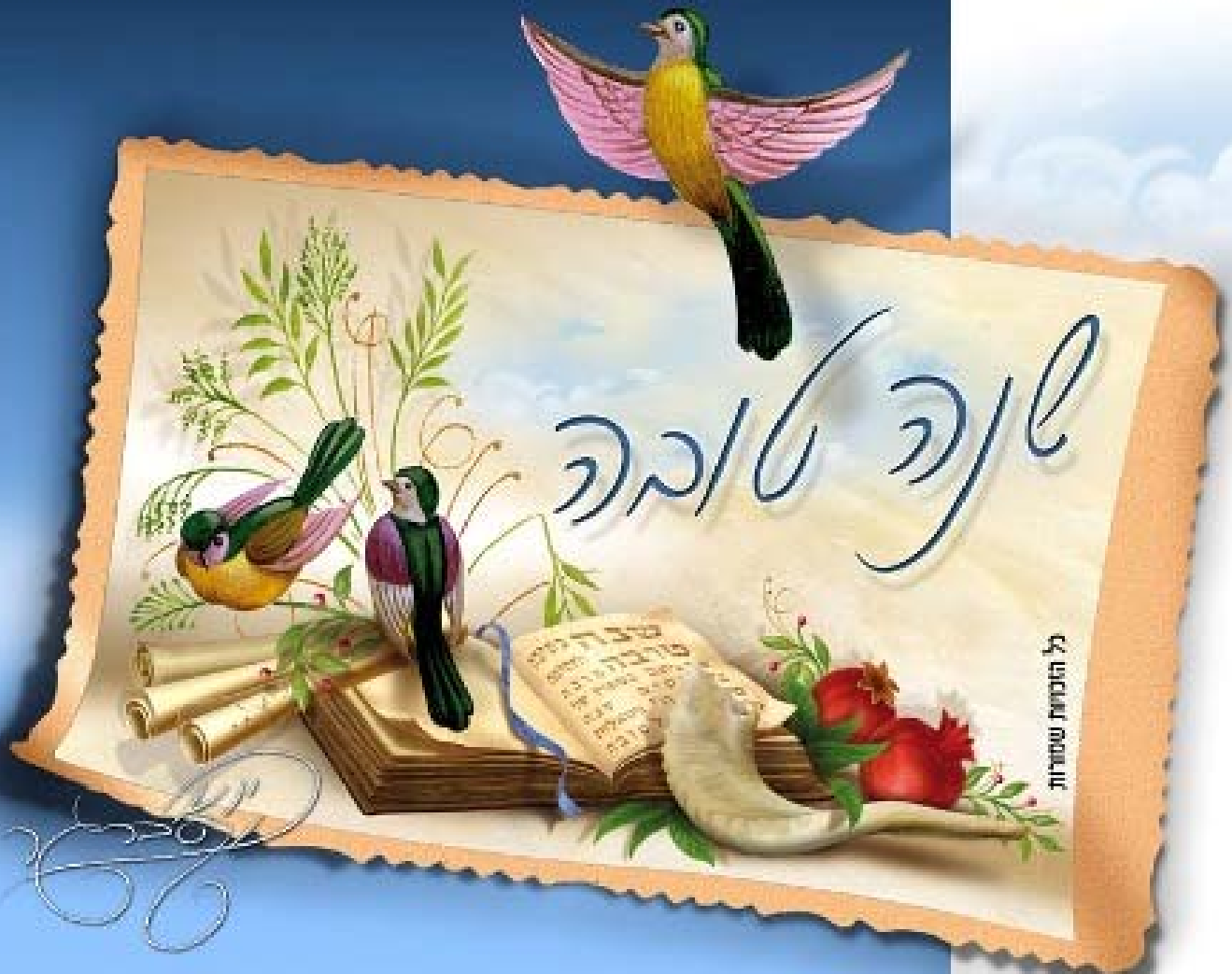
כל הזכויות שמורות

מזכרות לאירועים - עור אומנותי - דפי רקע - כרטיסי ברכה - אריזות שי - קישוטי שולחן רח' הלפרין 18 בני ברק טל. 03-518-60-50 פקס. 03-6192858 אימל: info@mgaw.co.il