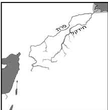
תרשים 2: הנהרות זורמים מדרום לצפון

בירם - מערבית לפרת - מיוחסת. חבילימא (=פרת-דבורסי), וכ"ש שוניא וגוביא וציצורא - המעולים שבבבל. רב: נהר חלזון - מיוחסים; ר' יוחנן חולק: "וינתם בחלק (חלזון) ובחבוק (חדייב) נהר גזן (גינזק) וערי מדי (חמדן) ויא נהוונד (חברותיה) - כולן פסולות. ומיבמות (סא-ט): העיד ר' דוסא בשם חגי הנביא, שמקבלים גרים מבני קרדו (אך לא מן הקרתיים, מפני תערובת מזורים, צאצאי בנות ישראל, וכסובר שולדן מגוי ממזר) ותדמור. ר' יוחנן א, רב יוסף: מתדמור לא (צאצאי בנות ישראל שנחטפו בידי עבדי שלמה, ויא בידי גויים בשעת החורבן), ופסוליהם התגלגלו למישן ולהרפניא.