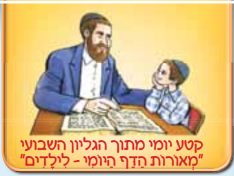
קטע יומי מתוך הגליון השבועי "מאורות הדף היומי - לילדים"

מסכת חלין • דף קמ"א • יום שני י"ז במרחשון