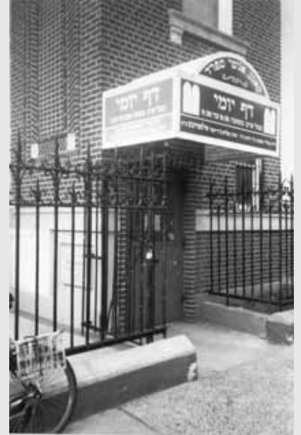
רעיון לגבאי בתי הכנסיות, להגדלת מעגלי לומדי הדף היומי.

הרב ? ה. מבית וגן שבירושלים, שהה בבורו-פארק, וכה התרשם מאשר חזו עיניו, עד שהנציח את הדברים בתמונה. כלומד דף יומי מובהק, הוא תר אחר מקום שבו לומדים דף היומי, ולא חלף זמן רב עד שהוא מצא את מבוקשו באופן מפתיע ביותר. ב-14 avenue פינת רחוב 45, התנוסס שלט מאיר עיניים: "כאן לומדים דף יומי בכל ערב, משעה 8:30 עד 9:30". נכנסתי, הצטרפתי ונהניתי מאד.