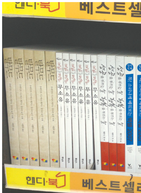
ספרי יהדות בספריית חב"ד בטיאול