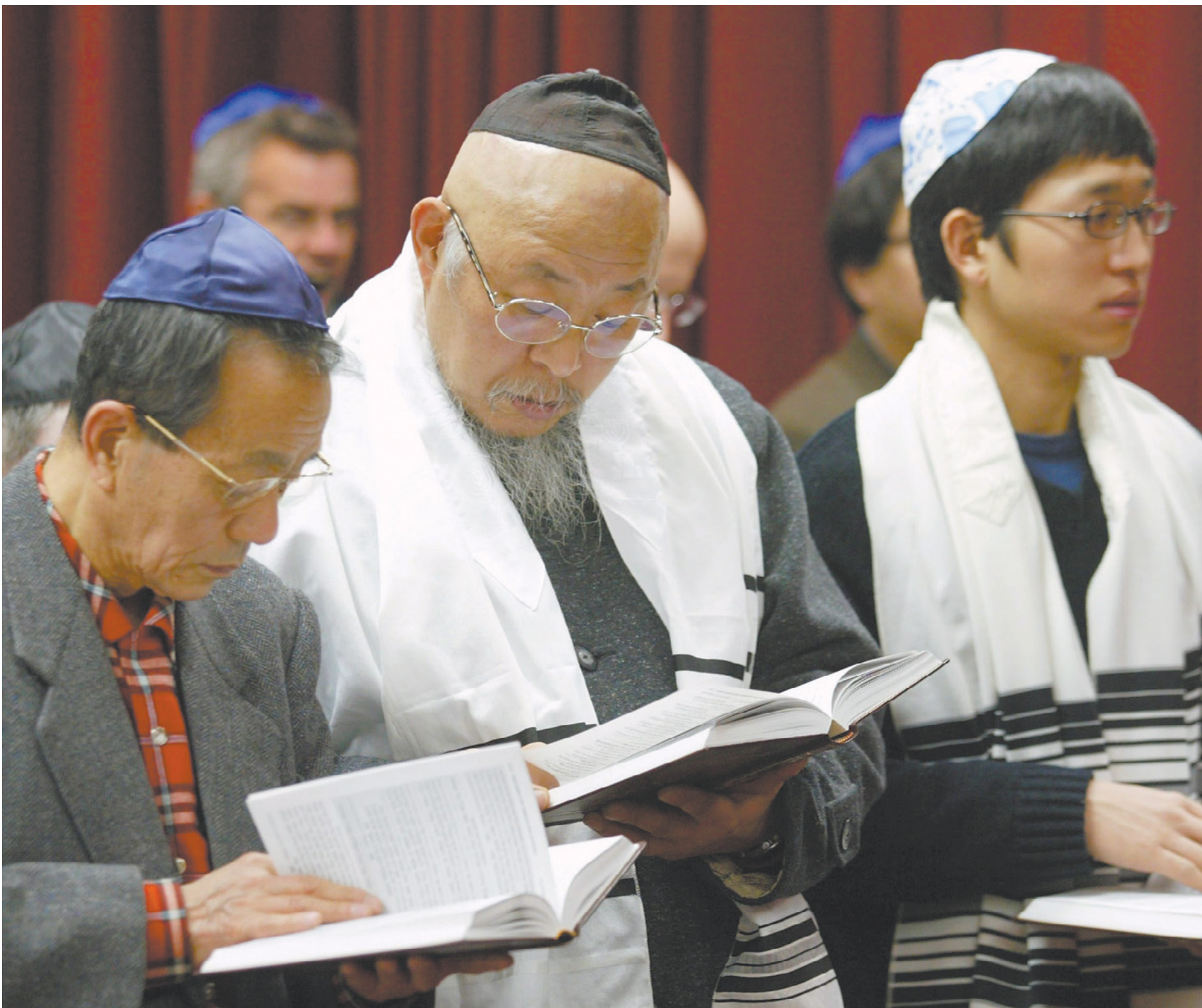
תפילה בבית חב"ד בסיאול. שיעורי תלמוד במסגרות ההשלמה לבתי הספר הממלכתיים

בימים של רוחות אנטישמיות, נעים לגלות שבקצה השני של העולם יש מיליוני אנשים שגומעים בצמא את קסמי היהדות • ספרי התלמוד, פרקי הגמרא והתרבות בישראל בכלל הם להיט בדרום קוריאה, והיריעה מתרחבת גם לקלאסיקות ילדים דוגמת "מעשה בחמישה בלונים" ו"דירה להשכיר" שנמצאות בספריות רבות • שגריר קוריאה בישראל, המעיד על עצמו כי גדל על ברכי היהדות: "כל אמא קוריאנית מאמינה שאם תיתן לילדיה לטעום מהחוכמה היהודית, יהיה להם סיכוי להגיע לפרס נובל"