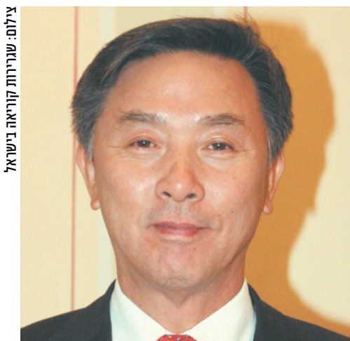
שגריר קוריאה בישראל, קים איל-סו

"סודות הקואצ'ינג היהודי" מאת בני גל, בתרגומו לקוריאנית