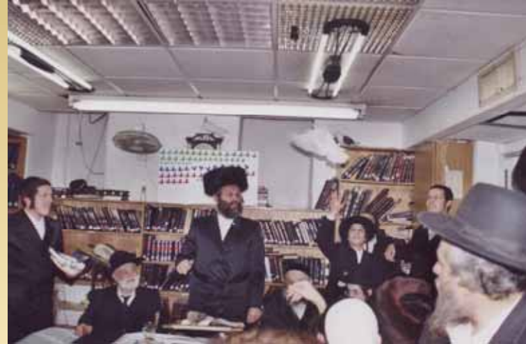
השעה הייתה 6:15 בבוקר, כשמהדלת הראשית נכנס... תור והחל לעופף בחדר