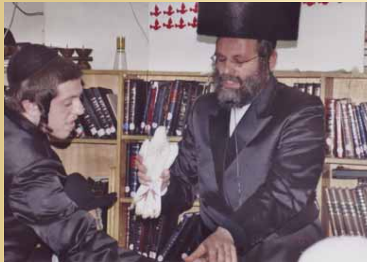
ארבעה ימים שהה ה'תור' במחיצתנו עד שסיימנו לעסוק בהמחשות הנוגעות ל'תור'. לכשבאנו לשלחו לחופשי גילינו שהוא אינו בין החיים...