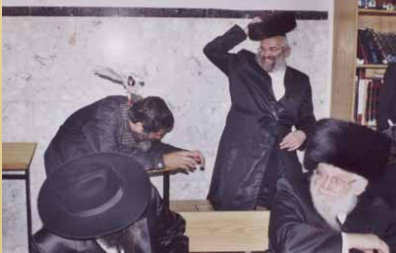
תלמיד זריז שם את ידו עליו וצירפו לשאר היונים שבאמתחתי.