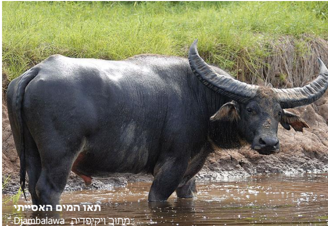
תאו המים האסייתי

תאו המים האסייתי (Bubalus bubalis) – ג'מוס הג'מוס הוא בעל חיים מבוית או מבוית למחצה שאוכלוסיית הבר שלו מצויה במקום מוצאה הטבעי בסכנת הכחדה. ממין זה בויתו במהלך אלפי שנים גזעים שונים המשמשים את האדם לשימושים הדומים לאלו של בקר הבית: בשר, חלב, עורות וכבהמת עבודה. בעל חיים זה נודע כחובב מים וביצות. הוא היה מגודל ערב הקמת המדינה על ידי הערבים, בעיקר באזור החולה (אם כי יש מידע שגודל על ידיהם גם במישור החוף). כיום עדר ג'מוסים מגודל על ידי רשות הטבע והגנים בשמורת החולה ובמספר אתרים נוספים. פסיקת הראש"ל הרב שלמה עמאר אישרה את כשרותו של הג'מוס המגודל היום בארץ גם בחוות גידול לצורך שימוש בחלבו. גבינת המוצרלה יוצרה במקורה מחלב ג'מוס.