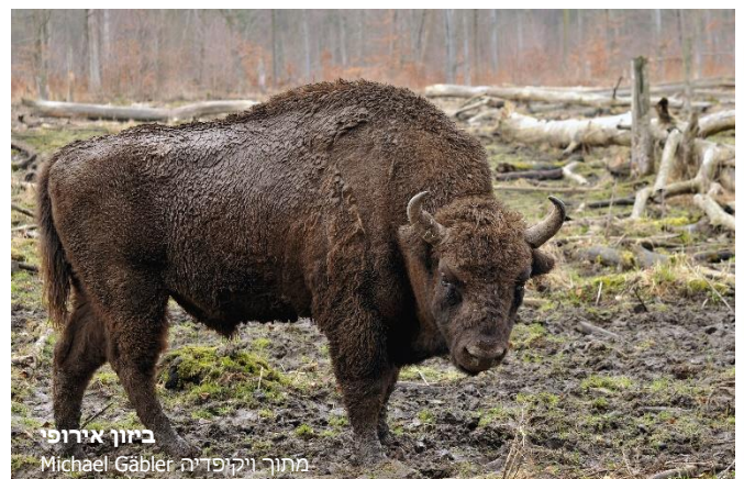
ביזון אירופי

מימדיו של הביזון האירופי דומים לאלו של שור הבר האירופי. אורך גופו הממוצע של בוגר הוא 2.9 מ', וגובהו 1.9-2 מ'. משקלו יכול להגיע לטון. הביזון האירופי מסיבי יותר ממקבילו האמריקני, והוא חי ביערות או באדמות הדשא שסביב היער (בניגוד לביזון האמריקני שחי בערבות הרחבות). הביזון היה מצוי ברחבי אירופה מספרד עד שוודיה ומבריטניה עד סיביר, אולם הוא נכחד מרוב האזורים וגם הוא נותר רק באזור פולין, שם נחשב רכוש המלך ונאסר על צייד שלו. הפרט האחרון בטבע ניצוד בצייד לא חוקי ב-1919. ניסיונות לשיקום האוכלוסייה מ-12 פרטים שנותרו בגני חיות הצליחו להשיב את הביזונים לטבע בכמה מדינות במזרח אירופה ומספרם מונה כיום כ-3,000 פרטים.