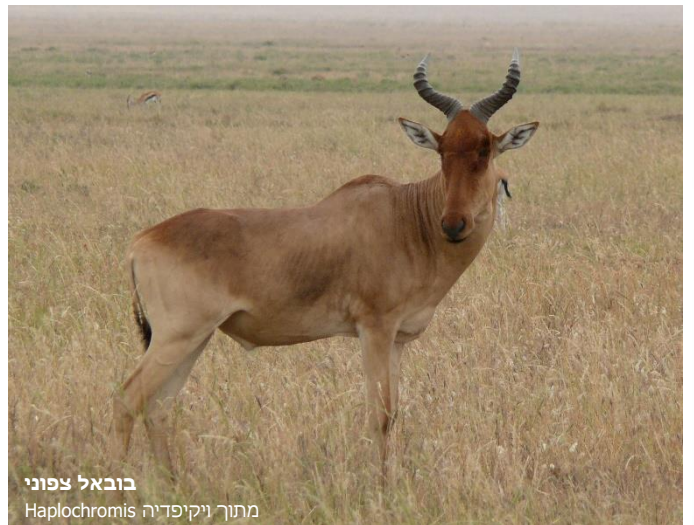
בובאל צפוני מתוך ויקיפדיה Haplochromis

בעל חיים זה הוא היחיד מאלה שהזכרנו ששייך לתת משפחה אחרת לגמרי במשפחת הפריים. גם מידות גופו קטנות יותר מאלו של המינים הקודמים: אורכו (של תת המין הצפוני שהיה חי בארץ) הוא 2.45 מ', גובה הכתפיים 1.2 מ' ומשקלו 120-150 ק"ג. צבעו חום-אדמדם והוא חי כיום בסוואנות של אפריקה. קרניו כפופות כנבל ודומות לקרני הבקר, ואף שמו הנוסף בעברית הוא אנטילופת השור. ראשו מוארך וחלקו הקדמי גבוה מזה האחורי.