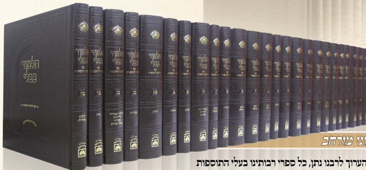
פורמט בינוני מורחב

בתוספת ספר הערוך לרבנו נתן, כל ספרי רבותינו בעלי התוספות עם הגהות והוספות מגדולי ישראל, עין משפט השלם.