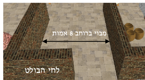
לחי בולט ברוחב 4 אמות לחי ברוחב 4 אמות