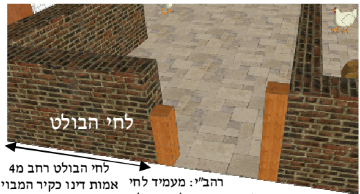
רב פפא: מעמיד לחי רחב"י: מעמיד לחי שונה מלחי הבולט אמות דינו כקיר המבוי

לחי הבולט מדפנו של מבוי, פחות מארבע אמות - נידון משום לחי, ואין צריך לחי אחר להתירו (את המבוי בטלטול). ארבע אמות - נידון משום מבוי (כקיר המבוי) וצריך לחי אחר (בנוסף ללחי הבולט) להתירו.