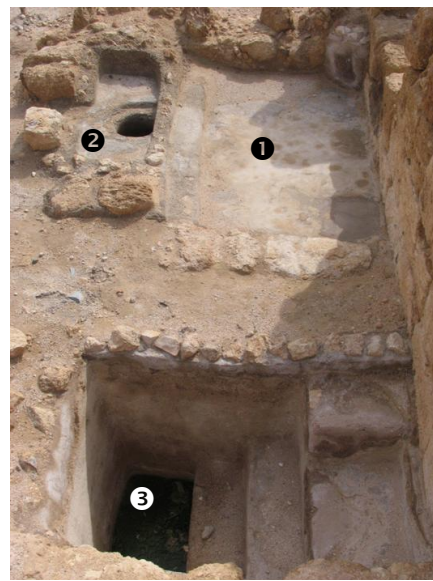
איור 2 - המקווה המערבי, מבט לדרום 1 - משטח מטויח; 2 - בריכה ותחתיה מיכל; 3 - בריכת טבילה