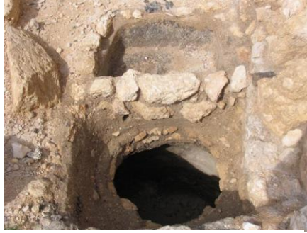
איור 6 - המקווה המזרחי: בריכות המים ומיכל המים שתחתן בשלב השני לקיום המקווה

הטבילה שלו גדולה יותר: ממדיה כ- 2.3x4 מ', עומקה המירבי 2 מ' ונפחה כ- 9 מ"ק. גם במקווה זה נבנתה בריכת מים קטנה ותחתיה מיכל מים פעמוני, שניהם בממדים דומים לאלו של המקווה המערבי, אלא שבשונה ממנו מיכל המים נבנה צמוד לקיר המערבי של בריכת הטבילה ונקב חיבר אותו עם בריכת הטבילה (איור 5). בשלב הראשון היו ממדי הבריכה העליונה 0.6x1.25 מ' וכ- 0.5 מ' גובהה, ונפחה היה מעל 1/3 מ"ק. בשלב השני, שהוא הנראה היום (איורים 6, 7), חולקה הבריכה לשניים וחלקה הצפוני שימש כבריכת ניקוז, שממנה הוזרמו המים באמצעות צינור אל המיכל התחתון, אשר בשונה מהמקווה המערבי המשיך לתפקד גם בשלב זה. בהמשך הדברים נדון רק בשלב הראשון של המקווה.