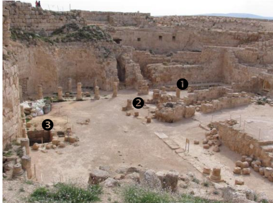
איור 1: ארמון מבצר ההר בהרודיון ומקום המקוואות 1 - בית הכנסת; 2 - המקווה המערבי; 3 - המקווה המזרחי