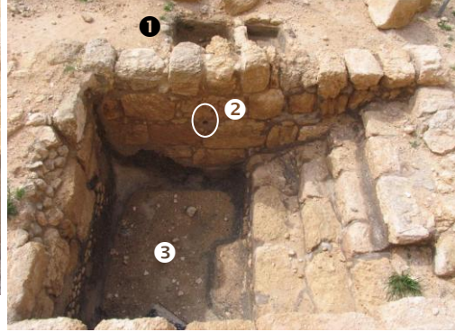
איור 5 - המקווה המזרחי, מבט למערב 1 - בריכות ותחתן מיכל מים; 2 - נקב; 3 - בריכת טבילה

את שני המקוואות שהתגלו בהרודיון ניתן להשוות למקוואות מהטיפוס של צמד מקוואות. במקוואות מטיפוס זה קיימת בריכת טבילה מדורגת ובריכה נוספת ששימשה כ'אוצר'. לעתים בריכת ה'אוצר' צמודה לבריכת הטבילה ולעתים היא מרוחקת ממנה מעט; לעתים יש בה מדרגות ולעתים היא חסרת מדרגות. כאשר לא היו לבריכה מדרגות יש לשער שהיא לא שימשה לטבילה של כל הגוף אלא יועדה לשמש רק כ'אוצר', אף שאין מניעה שהטבילו בה כלים (ובגדים) ואף יכלו להטביל בה ידיים. כאשר היו לבריכה מדרגות היא יכלה לשמש לסירוגין כמקווה וכ'אוצר'. אפשר שזה היה הנוהג השכיח, כפי שאנו מוצאים במקורות חז"ל רבים, שבהם יש התייחסות זהה לכל בריכה וכל אחת מהן נקראת מקווה (המונח 'אוצר' הוא חדש יחסית), כפי שנאמר במשנה (מקוואות ו, ח): "מטהרים את המקוואות, העליון מן התחתון, והרחוק מן הקרוב...".