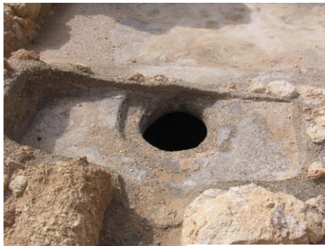
איור 3 - המקווה המערבי, הבריכה העליונה ופתח מיכל המים (המגרעת) שתחתיה

המקווה המזרחי (איור 5) דומה במבנהו ובמרכיביו למקווה המערבי, אך בריכת