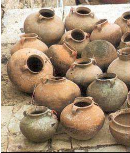
סירי בישול מנוקבים מ"בית המידות" ברובע היהודי.