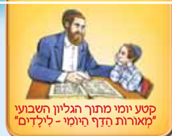
קטע יומי מתוך הגליון השבועי "מאורות הדף היומי - לילדים"

תלמיד חכם אינו רשאי לשכוח את חידושי תורתו! נסיים בחידוש מעניין מאד מבית מדרשו של הגאון רבי נפתלי צבי יהודה ברלין זצ"ל, הכותב ("הרחב דבר" דברים ט/ט), כי את איסור שכחת התורה אין למדים מגמרתנו, כי אם מן הגמרא ביומא (שם) האומרת: "ואמר רבי אלעזר, כל המשכח דבר מתלמודו גורם גלות לבניו, שנאמר ותשכח תורת אלקיך אשכח בניך גם אני". מגמרא זו אנו למדים, שמוטל איסור על היהודי לשכוח את תורת האלוקים. ואילו גמרתנו מחדשת איסור אחר: "כל המשכח דבר אחד מתלמודו" - תלמיד חכם אינו רשאי לשכוח גם את חידושי התורה שהתחדשו לו במהלך לימודו: "אזהרה על תלמידי חכמים העוסקים בחוקים ומשפטים שלא ישכחו מה שהעלו משנה שלהם מתוך העיון. וזהו לשון מתלמודו, היינו מה שלמד והוכיח בשכלו".