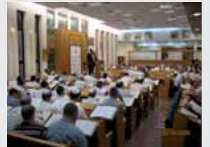
אכן, תמונה מרשימה.

מצורפת בזה תמונה משיעור שהתקיים השנה במוצאי יום כיפור תשס"ט בשעה 20:00 לאחר הצום.